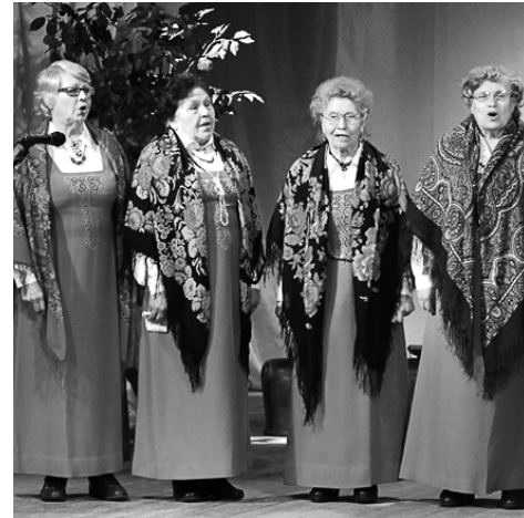
Список творческих коллективов и солистов АУ «Поваровский культурный центр».